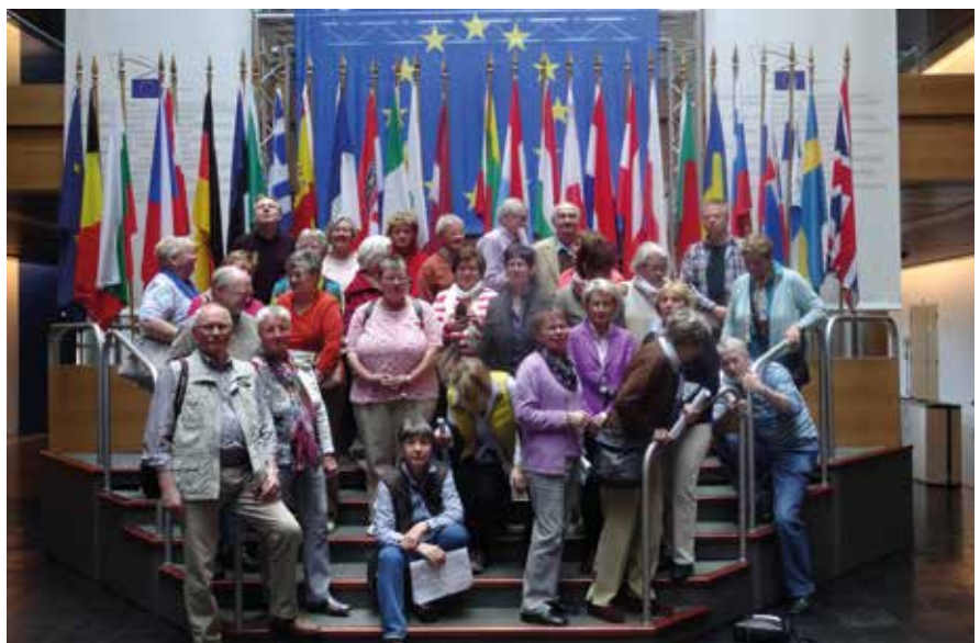
Im Europaparlament in Straßburg