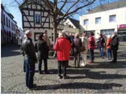
Vor dem Willy-Brandt-Forum in Unkel