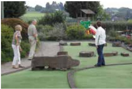
Konzentration beim Minigolf