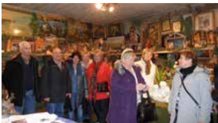
Krippenausstellung in Rech an der Ahr

Einen guten Anklang fanden auch die Besuche der Ordensburg Vogel-sang, des Observatorium Hoher List und einer Glockengießerei in der Eifel sowie von Duisburg-Marxloh mit der Hochzeitsstraße und der Moschee. Letztere Aktivität wurde von den Hennefern übernommen nach dem Motto, das Rad nicht zum zweiten Mal zu erfinden.