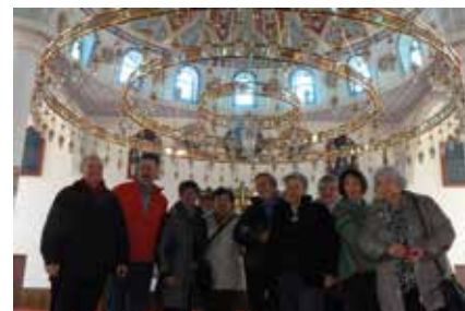
In der Moschee von Duisburg-Marxloh