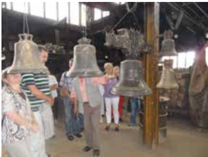
In der Glockengießerei in Brockscheid